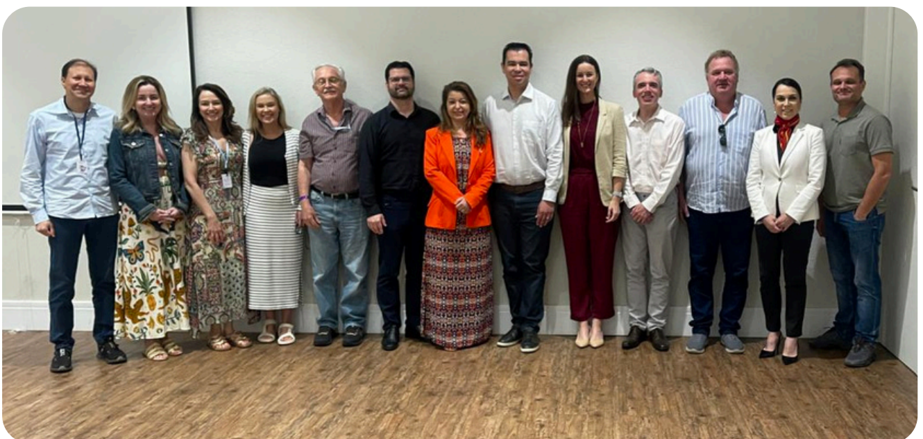
Convidados, organizadores e participantes do Encontro.